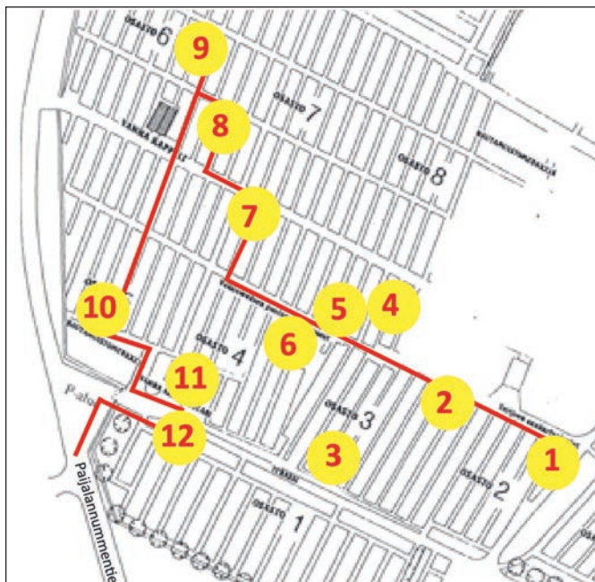
Kartta: Tuula Rasilainen, SRK