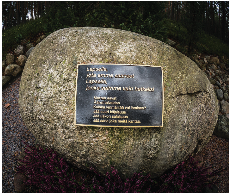
Tyhjä syli.