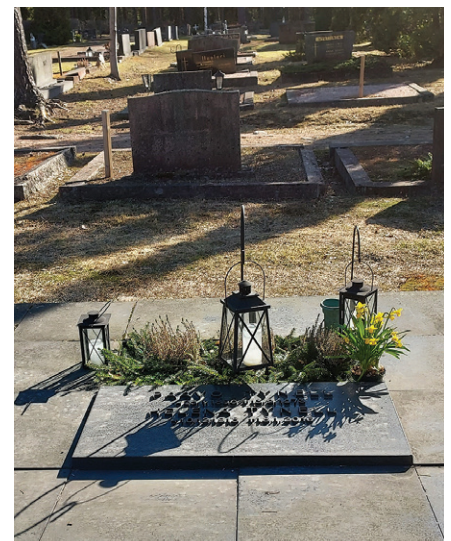
Taiteilijapariskunta Paavo ja Helena Tynell olivat maailmankuuluja muotoilijoita.