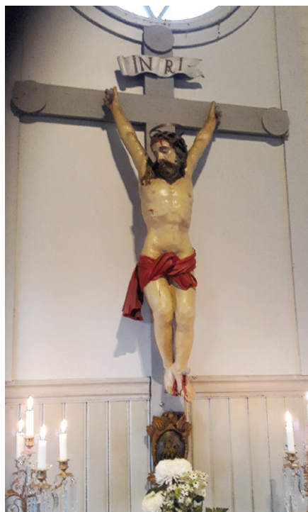
Kappelin arvokas krusifiksi.