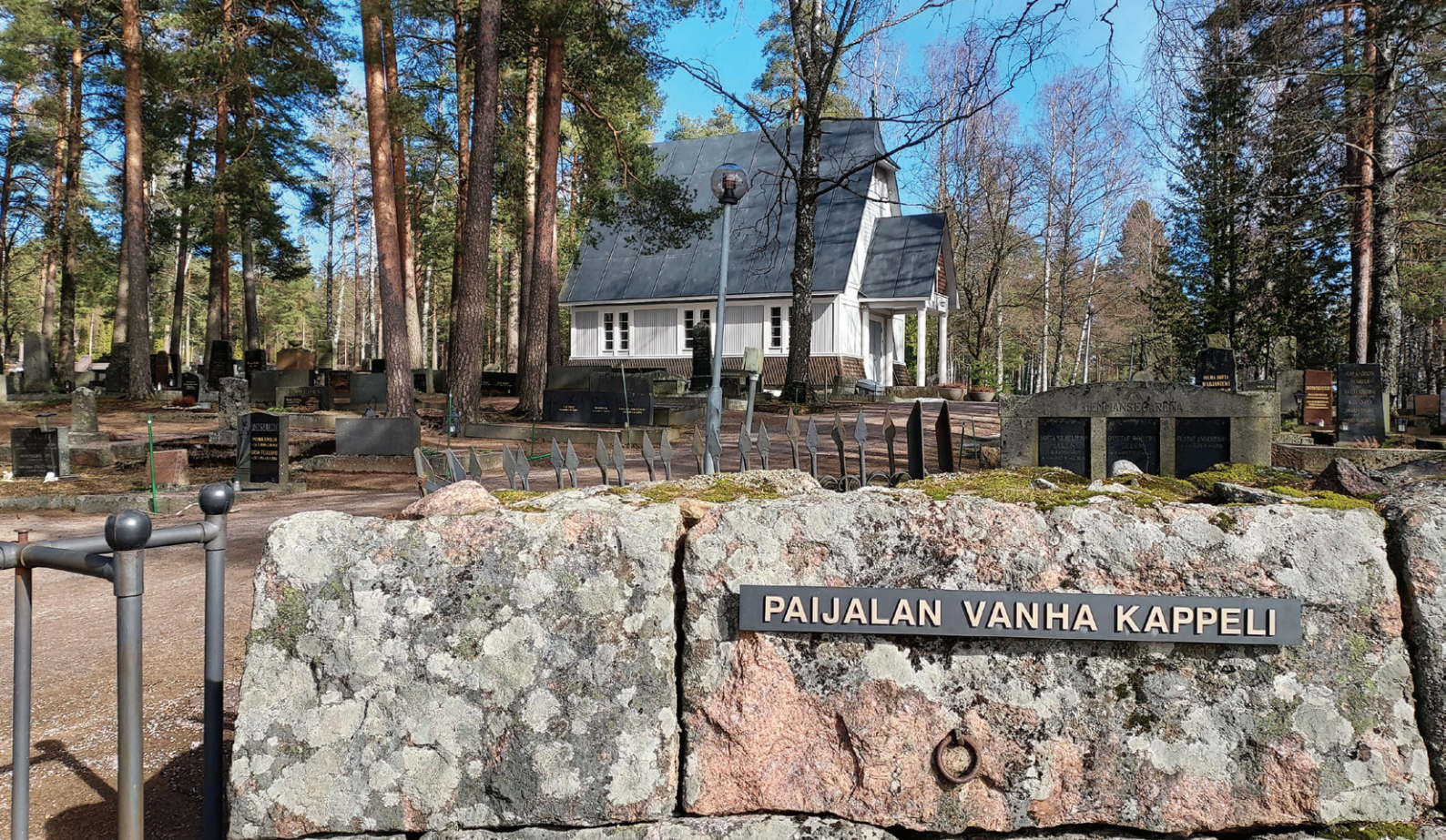
Komeassa kiviaidassa on jäljellä parin metrin välein hevosten kiinnitysrenkaita 47 kappaletta.

ta, etenkin uusi leikkuhuone oli välttämätön, koska ruumiinavaukset tehtiin siihen aikaan kirkon läpikäytävässä - porttihuoneessa. Komitea etsi hautausmaan paikkaa Hyökkälän kylästä. Komitea uurasti yli kaksi vuotta ja elokuussa 1892 kirkonkokouksessa todetaan: "Kun Klaavolan rusthollarin omistaja W. Kollin tahtoo tynnyrin alalta (noin ½ ha) 2000 markkaa ja kun maa on vesiperäistä, päätetään etsiä uutta aluetta hautausmaaksi.