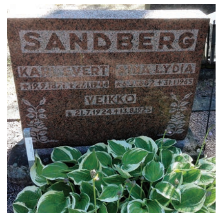
Kappelin rakensi Karl Sandberg, joka rakensi Tuusulaan monia rakennuksia, muun muassa vanhan kunnantalon. Hänen hautansa on kappelin läheisyydessä.

1693. Museoviraston konservoinnin asiantuntijan kuvan tulkinnan mukaan kysymyksessä ei ole ollut konservointi, vaan kunnostus on tehty päälle maalaamalla.