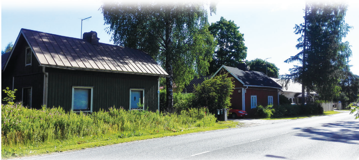
Koskenmäentie 15 ennen purkamista 2020. Männikkö II- talo vuodelta 1931 oli Salmion koti. Nämä talot ovat kulttuurihistoriallisesti arvokkaita, Aarne Männikön tuotantoa.