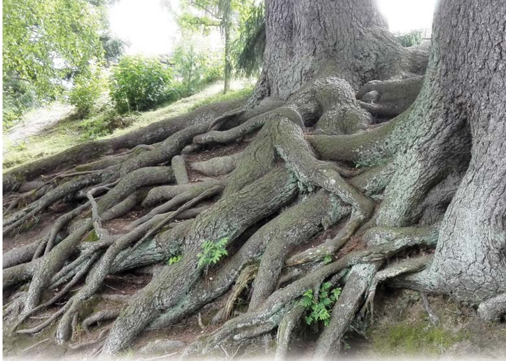
Kirkkopuiston rantakuusien vahvat juuret.

Uskonpuhdistuksen jälkeen luterilainen kirkko painotti siunattuun maahan hautaamista. Sitä pidettiin välttämättömänä 1600-luvulta alkaen ja meillä vuoden 1686 kirkkolaki teki sen pakolliseksi. Hautausmaille, jotka olivat yleensä kirkon ympärillä, muodostui eriarvoisia hautapaikkoja. Kaikkein arvokkaimpia olivat hautapaikat kirkon sisällä, kirkkotarhassa taas kirkon etelä- ja itäpuolella.