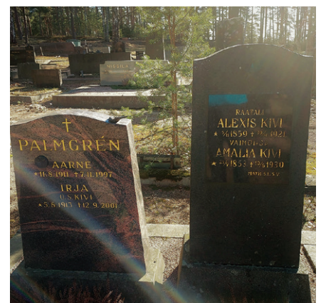
Räätäli Alexis Kivi otti setänsä nimen.