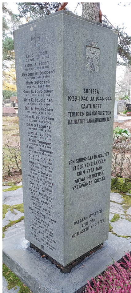
Terijojeen sotilaskotiyhdistyksen pyytämä muistokivi Terijojeelle haudatuille sankarivainajille. Kivessä on 75 sankarivainajan nimet.