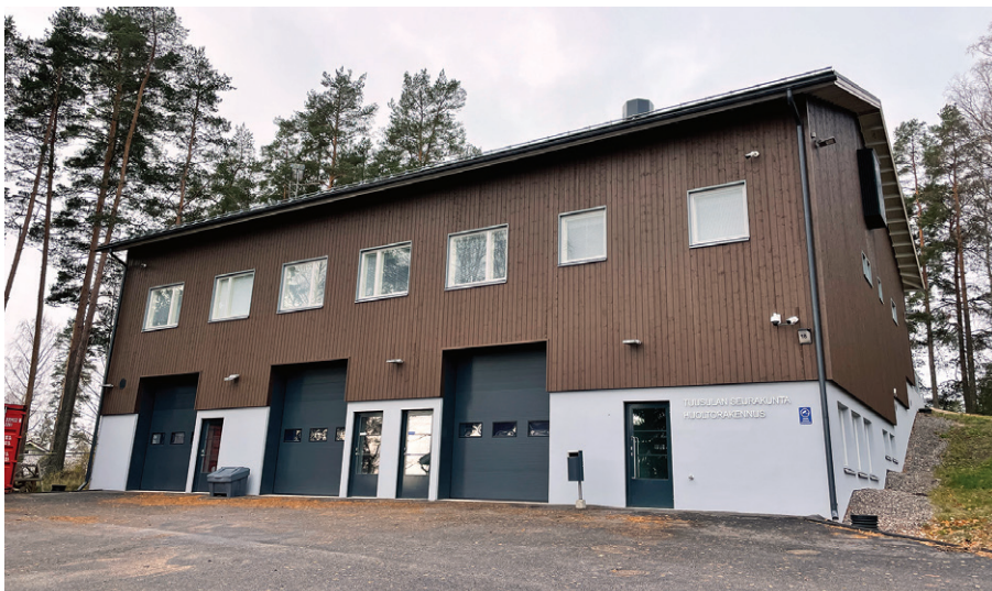
Huoltorakennuksessa ovat tilat kiinteistötoimelle ja hautaustoimelle. Rakennuksen on suunnitellut arkkitehti Olli Kumpulainen ja rakentajana Kymppirakenne Oy ja se valmistui 2019.