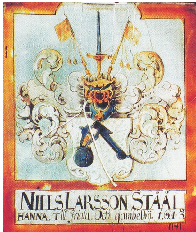
Stålhanan ikkunaruutu on Kansallismuseossa.

Asukasluvun kasvaessa Kirkkopuisto alkoi käydä väistämättä ahtaaksi. Kirkkoon hautaaminen oli Tuusulassa lopetettu hygieniasyistä 1770-luvulla ja sekin osaltaan lisäsi kirkkomaan käyttöä. Kirkkoherra Vaarantauksen arvion mukaan kirkon hautausmaalle on vuosisatojen aikana haudattu noin 20 000 vainajaa, mutta hautamuistomerkkejä on jäljellä noin 180.