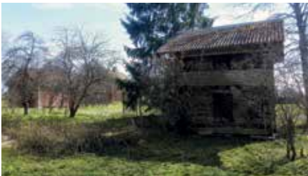
Vanhassa kuvassa näkyvä luhti on siirretty nykyisen Torpin pihapiiriin. Taustalla näkyy Tapanin rakennuksia.