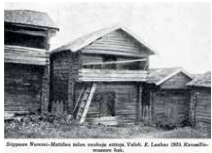
Nummisuutarien hääkohtaus filmattiin vuonna 1956 Nummi-Mattilassa.