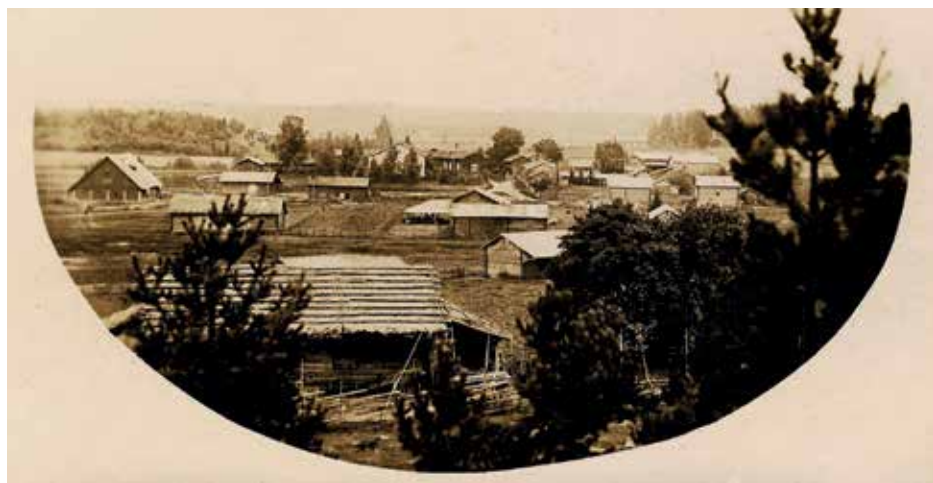
Siippoon Alikylä vuonna 1922. Kuva on otettu Mäkikylän suunnasta kaakkoon Siippoontien pohjoispuolelta. Kyläkirjan kuva

Vasemmalla on vieläkin jäljellä oleva Mattilan navetta, etualalla Heikkilän rakennuksia. Keskellä takana on Alikylä – neljän kantatilan paikka. Valkoinen pääty on Mattilan päärakennus, joka purettiin 80-luvulla. Sen vieressä on vieläkin säilynyt Tapani. Aivan Tapanin talon takana viistossa hämmöttää vielä Kylä-Heikkilän katon pitkä vaalea siluetti. Talojen kerrotaan olleen niin lähekkäin, että naapurit näkivät mitä ruokapöydässä oli. Kaikissa rakennuksissa oli pärekatot ja tulipalon