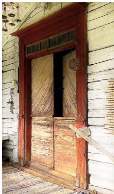
Susiovea voitiin kesäaikaan pitää alapuoli kiinni ja yläpuoli auki, jolloin sudet tai muut eläimet eivät päässeet sisään.

Museoviraston lausunnon mukaan Heikkilän tontilla on kaikkiaan kahdeksan rakennusta. Pihapiiriin kuuluu muun muassa asuinrakennuksen ohella kaksikerroksinen aitta, hirsiseinäinen satulakattoinen maakellari