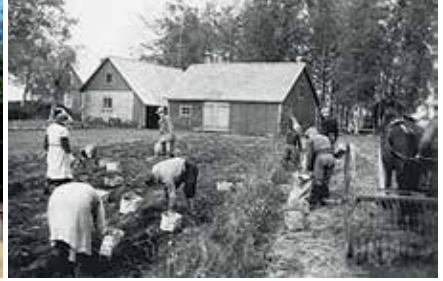
Kivisilta nyt. Kuva Heikki Simola. Kivisillan väki perunannostossa. Kyläkirjan Markku Mattilan kuva