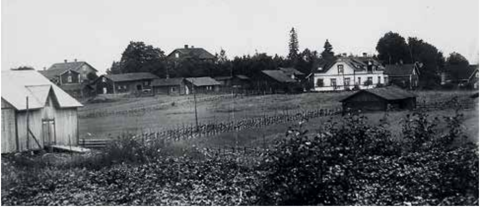
Rusutjärven ryhmäkylänäkymä vuonna 1929. Vasemmalta etualalla Eskolan lato ja sen takana talojen ulkorakennuksia. Ämmäkalliolla Mäkelä ja sen takana Ollila, Sorsa korkeimpana. Yli-Eskola pilkistää korkean kuusen takaa, 1910-luvulla rakennettu Reiman suurhuvila ja sen takana Ali-Eskola. Vaatimaton Rusutjärventie kulkee riukuaidan vierustaa.