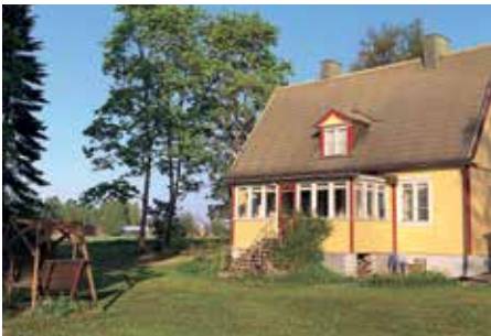
Leppäranta on Leppärannankujan ja sen rakennusten lähtökohtana.

kensi v. 1924 rakennusmestari Emil Salin. Parin hehtaarin tontti ostettiin Vihanto-Laurilta ja Salin rakensi sille myös vanhemmilleen päärakennuksen tyyliä jyrkkäharjaisen pienemmän talon Leppäranta 1 tontille. Tämän kiinteistön osti Lehtimäen perhe Tuusulan kunnalta ja rakentaa sille kivitaloa. Talo on itse suunniteltu ja isännän muuraama on A-luokan matalaenergiatalo, jossa on polte- tusta savitiilestä tehty yli puolen metrin kennoharkkorunko.