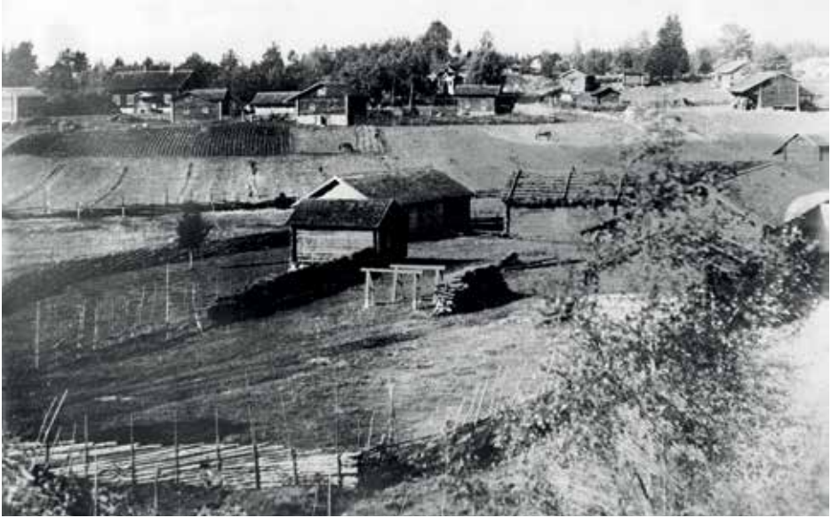
Näkymä Mäkikylään Alikylän Torpista otettuna lokakuussa 1917, etualalla Torpin ja Mattilan rakennuksia. Taustalla vasemmalla Mäki-Heikkilän (Heikkilä) rakennuksia. Keskellä oli kyläkauppa, oikealla Tavonin ja Smalenin rakennuksia sekä riihi – nykyinen Mattilan lato. Näiden välistä kuljettiin karryytiä pitäjän keskusta, Nurmijärven kirkolle.

ja pieni tallirakennus ylisille johtavine siltoineen, jotka muodostavat väljästi rakennetun pääpihan. Sen itäpuolella on ulkorakennusten muodostama karjapiha.