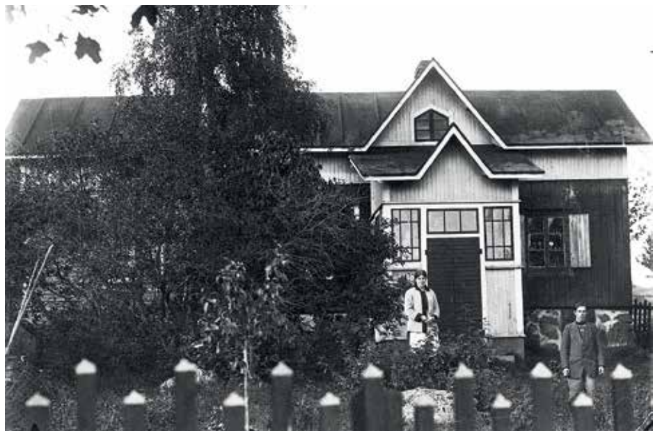
Siippon kyläkauppa.

Kun laskeudutaan kohti Palojokea oikealla jäävät Kivikon ja Peltomäen pientilat. Peltomäessä oli monta lasta. Kun muut olivat lähteneet kotoaan omille tahoilleen, jäi Pent-