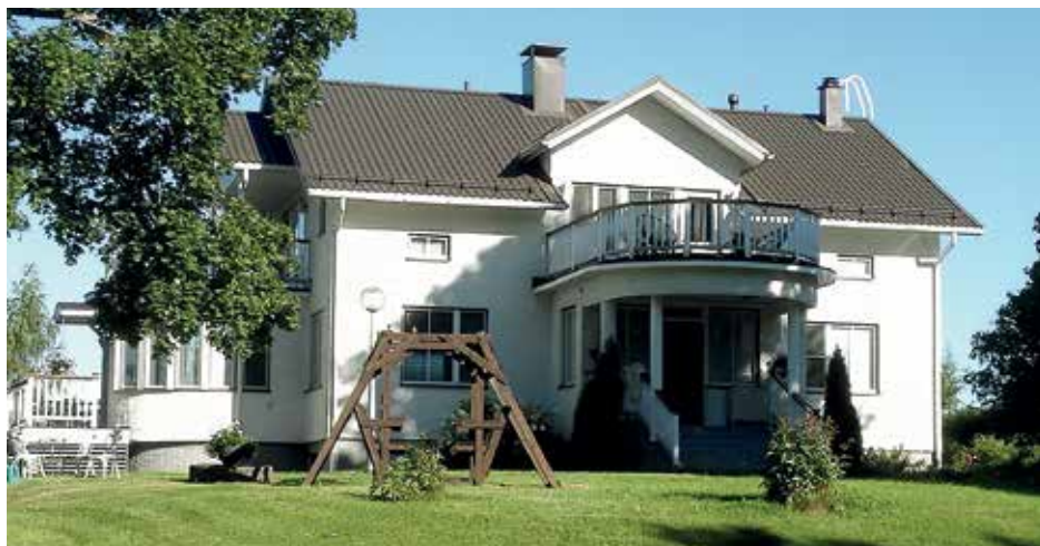
Komea Sorsan Talo Sepänmäellä ehostettuna 2020.