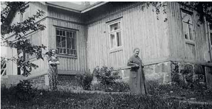
Sorsan päärakennus sijaitsi nykyosoitteessa Koivumäentie 220 Vuoren talon tontilla. Talon kivijalan kivet ovat nyt käytössä pihan penkereessä.