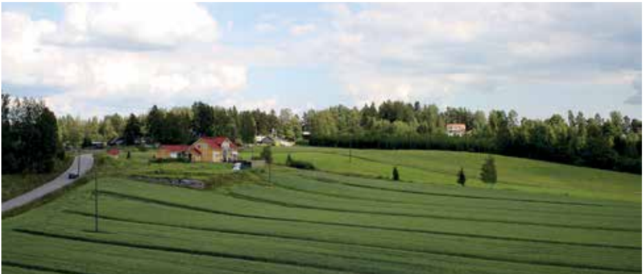
Mäkikylä Nurmijärven ja Palojoen suunnasta.