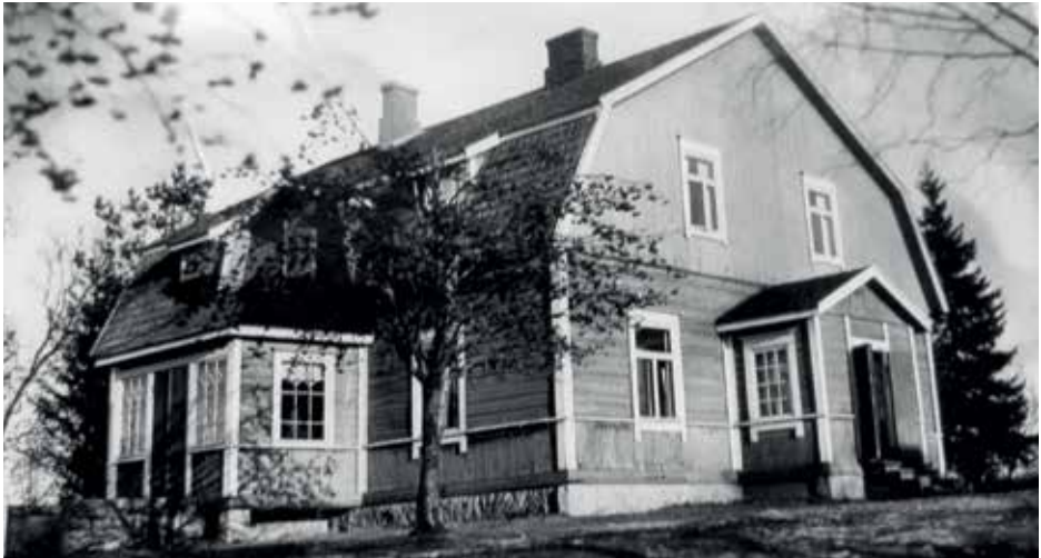
Mikkolan uudisrakennus valmistui 1920 ja on nykyään väriltään keltainen.

Rakennuksen hirret ovat talossa kolmannen kerran käytössä. Eskolanmäeltä hirret siirrettiin puretusta talosta Mikkolan mäelle tiensuuntaisesti rakennettuun taloon. Myöhemmin samat hirret käytettiin nykyisen talon rakentamiseen.