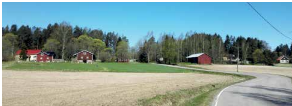
Näkymä Mäkikylään Alikylän suunnasta. Heikkilän tilakeskuksen rakennukset ovat Siippoon kauneinta rakennusperintöä. Pihapiirissä harrastetaan myös mehiläisten hoitoa. Kuvan oikeassa laidassa näkyvä entisen Suomelan torpan, nykyisen Saanijoen talon pääty. Kuva Heikki Simola