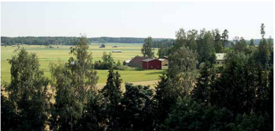
Isollaniityllä on myös Töyrylän viljelyksiä, tilakeskus erottuu peltoalueen laidalla.