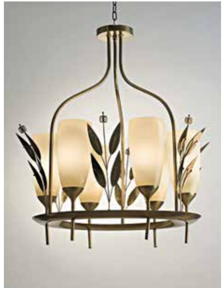
Paavo Tynell, Valkeakosken paperitehtaan edustustilojen valaisin, 1950-luku.

vulla uniikkivalaisimia myös koteihin. Valaisimia myytiin New Yorkissa suomalaisen designiin keskittyneessä Finland House-liikkeessä. Paavo Tynell palkittiin muun muassa