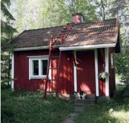
Kovia kokenut kaunis ja alkuperäinen puusauna pihan puolelta ja Kerttu-kissa.

Tila on lohkottu Ollilan tilasta vuonna 1921 ja se tunnetaan Kytökosken, tunnetun kaivonkatsojan talona. Sulo Kytökoski riisui kumite-räsaappaansa ja asteli paljain jaloin etsimässä vesisuonta varpu käsissään. Varvun taipuminen osoitti kaivon paikan.