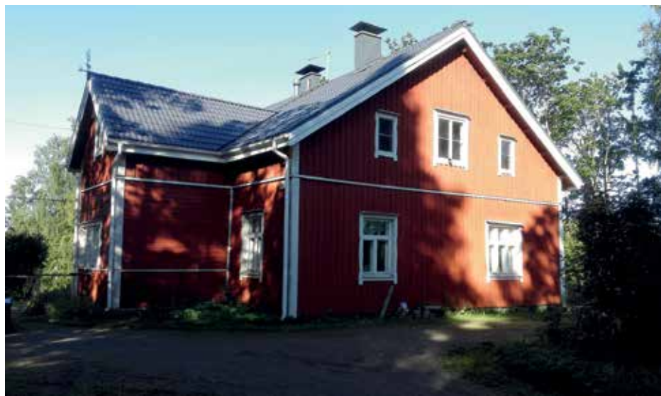
Järvelän kunnostettu päärakennus nykyasussaan.

Tuusulan kappalaiselta puuttui virkatalo. Envaldsin talo oli ollut huonolla hoidolla ja viljelijä irtisanottiin kruununtilalta. Kuningas vahvisti kappalaisen virkatalon syntymisen 25.4.1734.