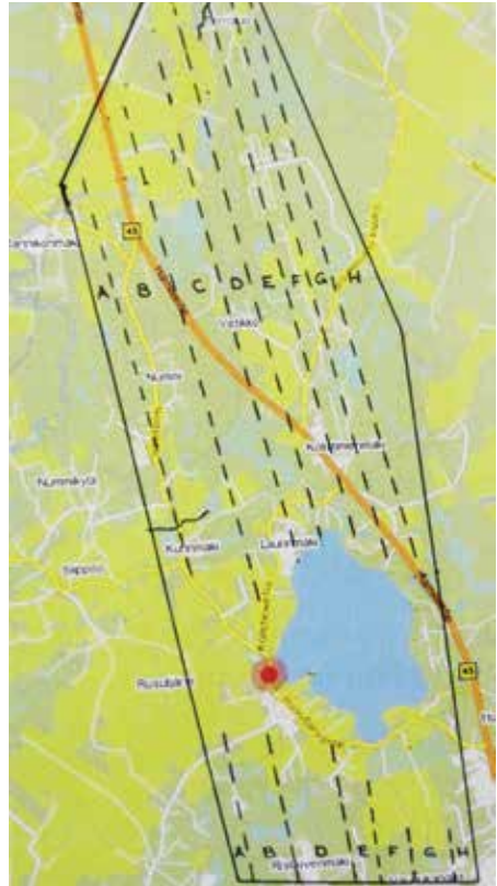
Isojaon päälinjat nykykartalla: A = Ollila, B = Sorsa, C = Katila, D = Eskola, E = Lauri, F = Mikkola, G = Kauko, H = Pappila.

Kruunun asetuksen määräyksellä isojaosa 1700-luvulla luovuttiin sarkajaosta ja yh-