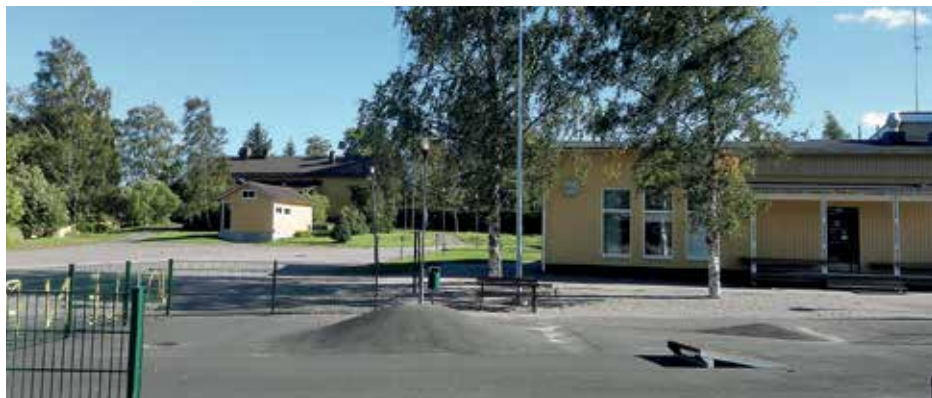
Taustalla Rusutjärven vanha koulu ja uusi koulu, jonka edessä Jollen piha.

Vuodet 1954–1961 muistetaan opettaja Olavi Naalisvaaran aikana, jolloin koulu me-