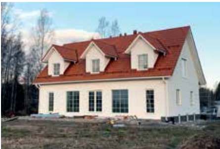
Rakenteilla oleva kulttuurihistorialliseen maisemaan sulautuva jyrkkäkattoinen kivitalo.

Kolistimentieltä johtaa koivujen reunustama Leppärannankuja järven rantaan Leppärannan talolle, mikä edustaa vanhaa huvila-asutusta Rusutjärven rannalla. Komean talon ra-