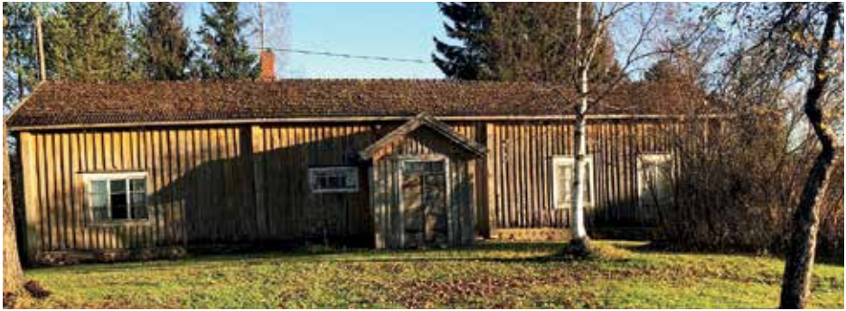
Tapanin vanha talo 1800-luvulta on ainoana säilynyt kantatalon alkuperäisellä paikalla.

on sotien jälkeen isännöinyt Vuoriston sukukunta.