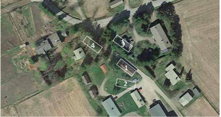
Ryhmäkylän neljän kantatalon pääpiirteiset paikat: 1) Tapanin vanha talo on jäljellä, 2) Heikkilä, 3) Mattila, 4) Torppi. Google Earthille piirtänyt Sari Rinne

vaara oli jatkuva. Koko kyläkeskus olisi tuhoutunut palon sattuessa. Oikealla on Kylä-Torpin (Torppi) rakennuksia ja taustalla Pelto-Torppi (Heinilä).