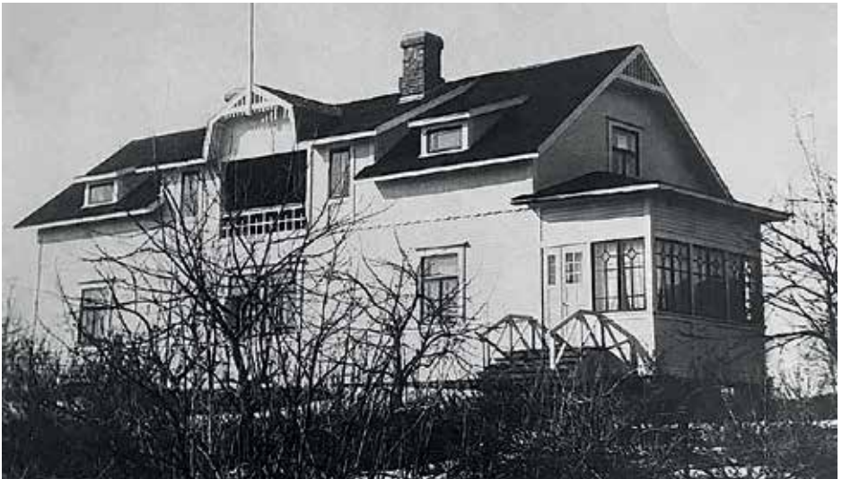
Reiman kartanohuvilan osti tukkukauppias Marttila ja Reima jäi asumaan tontin eteläosaan rakennettuun uuteen taloon.