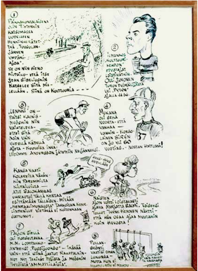
Tiikerin piirros Tuusulanjärven ympäriajosta, jota Sibeliuskin seurasi. Kuva Klaus Winqvist

Tiikeri piirsi urheilusta Helsingin Sanomiin vuoteen 1957 asti, peräti 30 vuotta. Tiikeri on samaa kuin pilapiirtäjä Kari Suomalainen poliitikalle. Tiikeri oli 1920-luvulla monipuoli-