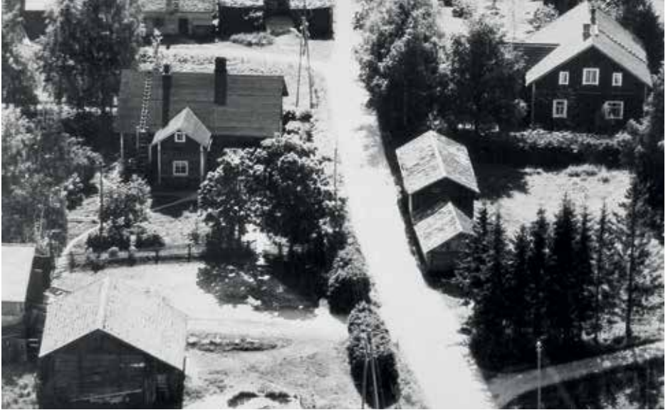
Kauko ja Järvelä 1950-luvulla, oikealle erkanee pappilaan pihatie. Kuvapostikortti Markku Mattila