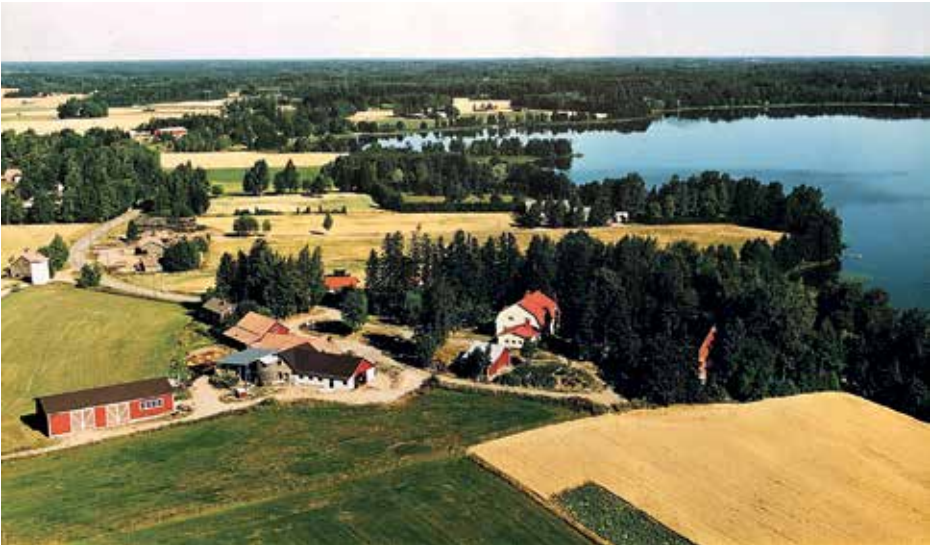
Mikkolan maitotilan maisemia 2000. Ilmakuva taulu talon pirtin seinältä

laajennus ja toiminnan elpyminen. Siinä sivussa koulutauduttiin ammattiin Mustialan opinahjossa ja innostus johti traktorikyntökilpailuihin. Tuloksia syntyi: kolme suomenmestaruutta ja MM-matkat Tasmaniaan ja Zimbabween.