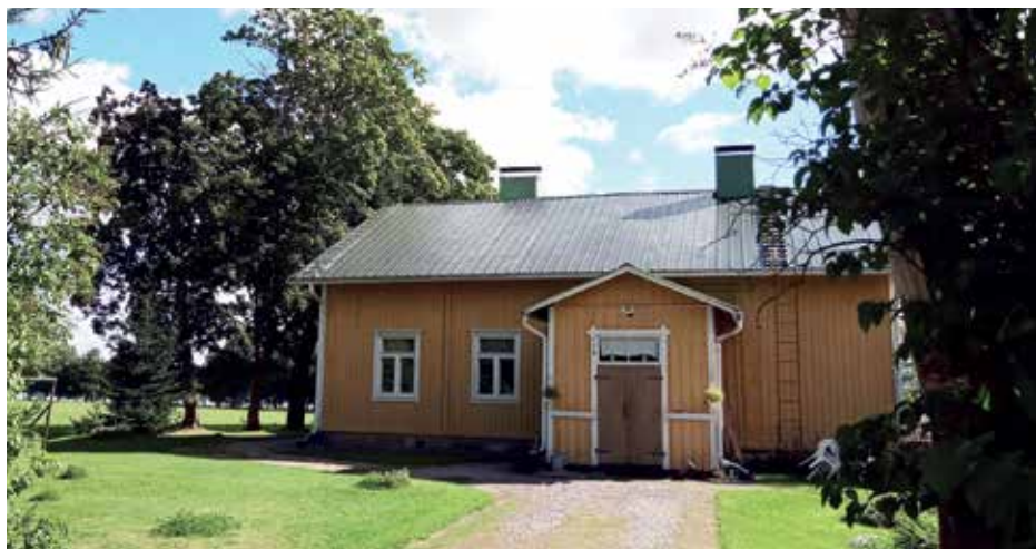
Katilan hyvin hoidettu talo kauniissa maalaismaisemassa. Kuva Viivi Kirvesoja