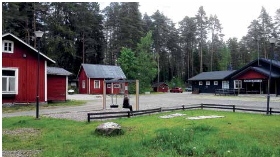
Metsäpirtin leirikeskuksessa on säästynyt vanha metsäpirtti vasemmalla ja riistanvartijan talo keskellä.

Voidaan sanoa, että 1800-luvun lopulla oli tsaarivallan aikana tyyntä ennen myrskyä. Korkean tason helsinkiläiset metsästäjät perustivat 1898 ”metsästyksenhoitoyhdistyksen”, Thusby Jaktvårdsförening, tarkoituksena metsästää ja hoitaa riistaa. Rusutjärven – Siipoon – Nahkelan laajat peltoalueet olivat hyvää peltopyyrymaastoa ja Tuusulanjärven luhtainen eteläpää oivallista sorsastusvettä. Palkattiin myös riistanvartija, rakennettiin vielä nytkin jäljellä oleva riistanvartijan talo, metsästäjille metsästysmaja ja koirille tarhat. Navetta ja saunakin rakennettiin ja vuonna 1906 ostettiin 1.5 ha maata Koukun tilalta, kiinteistö sai nimen Metsäpirtti.