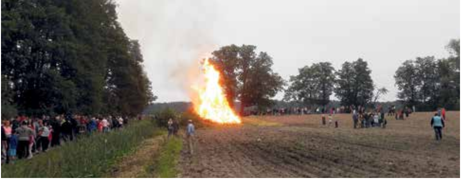
Satamäärin kokoontui väkeä juhannuskokon polttoon vuonna 2016.