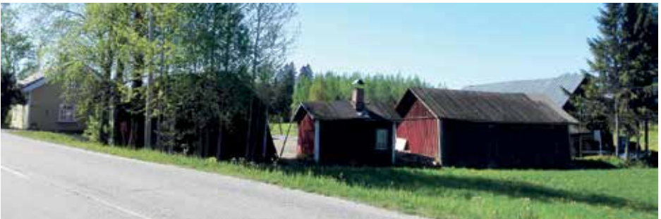
Vanhoja sepän rakennuksia 100 vuoden takaa on vielä jäljellä, nyt omistajana Indrek Körm.