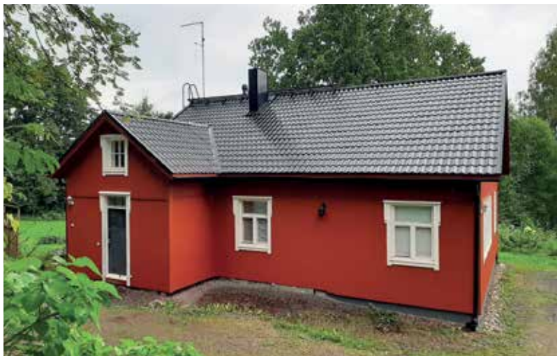
Reunan laajennettu ja remontoitu päärakennus nykyasussaan.