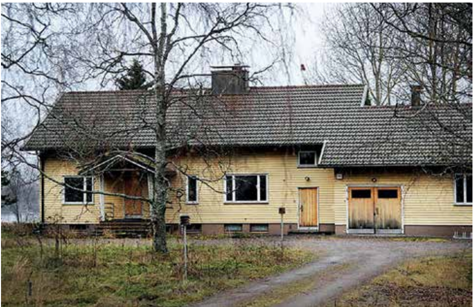
Rusutjärven pappila myytiin yksityisomistajille vuonna 2018.