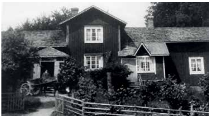
Yli-Eskolan vain kahdeksan vuotta vanha rakennus tuhoutui suurpalossa 1945. Kuvassa samalla paikalla ollut 1930-luvulla purettu talo.