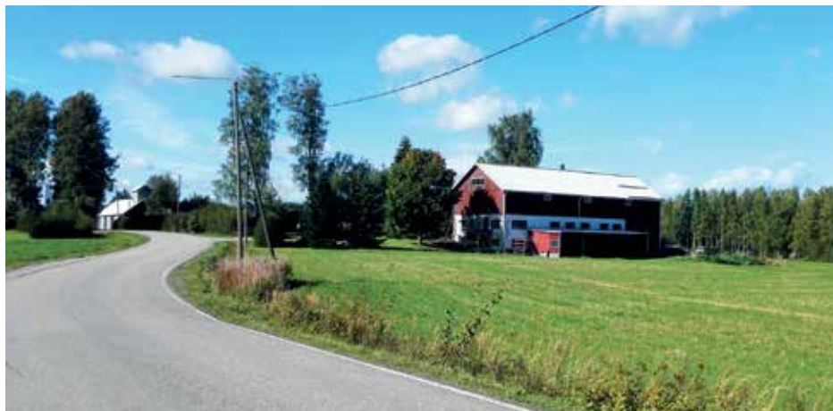
Kylänpään tilakeskuksen rakennuksia.

Helena Tynell piirsi uransa alussa miehensä suunnittelema valaisinmalleja puhtaaksi Taito Oy:ssä. Hän työskenteli samaan aikaan myös Arabian tehtaan taiteilijana keramiikan parissa, mutta siirtyi vähitellen muotoilemaan lasia. Suomalaisen lasimuotoilun uuden ajan lasketaan alkaneen vuonna 1946 littalalan lasitehtaan kilpailusta. Silloin Tapio Wirkkala ja Kaj Frank alkoivat muotoilla lasia litalalle ja Helena Tynell palkattiin Riihimäen Lasiin ensimmäiseksi vakituiseksi muotoilijaksi. Syntyivät teokset Lintupuu-vati, Sirkus