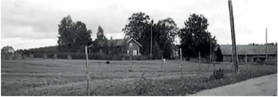
Vihanto-Laurin talo on ytimeltään kylän vanhin asuintalo.

tisöity ja palautettu paikoilleen. Talon sisäkatot ovat myös alkuperäiset. Lankkulattia jouduttiin uusimaan kokonaan vanhan lattian lahovian vuoksi. Kaikki talon hormit on uusittu. Samoin myös kaikki uunit muurattiin uudelleen vanhoihin peltikuoriin. Talo jatkaa nyt hyväkuntoisena elämäänsä uusitun vesikaton suojassa.