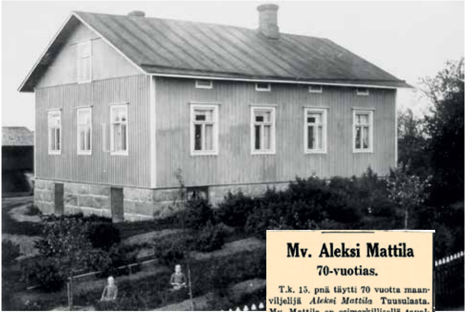
Mattilan päärakennus vuodelta 1914 Auralan-tieltä kuvattuna.