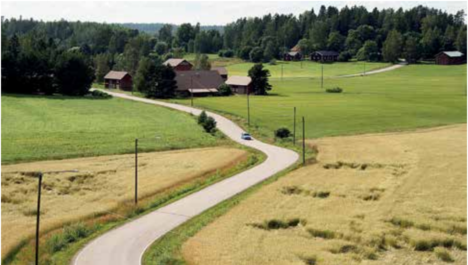
Maaseutumaisemat ovat Tuusulan kauneimpia. Näkymä Päivölästä Alikylään ja Mäkikylään.