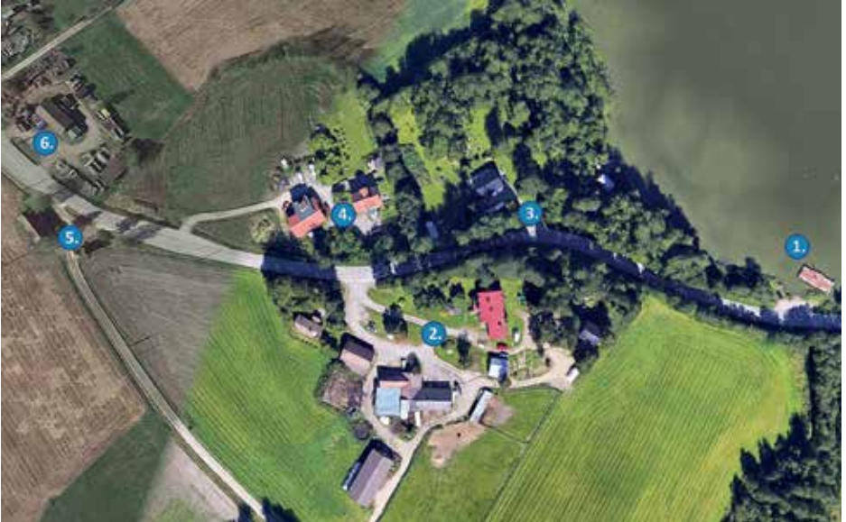
1) Kari Vaittisen liikuteltava ponttooni, jolta on tehty kaivinkoneella ruoppauksia 2) Mikkolan tilakeskus 3) Reuna 4) Mahlamäki 5) Muuntamo ja tanssilato 6) Saha. Google Earthin pohjalle piirtänyt Sari Rinne.