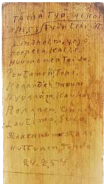
Rakennushistoriaa on löytynyt ja ra- kentäjissä on varmaan tuttuja nimiä jälkipolvillekin.