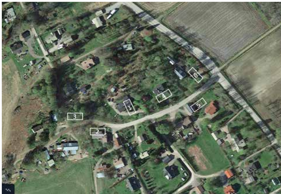
Ryhmäkylän talojen pääpiirteiset paikat reilut sata vuotta sitten: 1) Sorsa 2) Mäkelä 3) Ollila 4) Yli-Eskola 5) Ali-Eskola 6) Mikkola. Google Earthin kartalle piirtänyt Sari Rinne

Talojen jakamista ei sallittu pitkään aikaan, koska kruunu pelkäsi menettävänsä talojen verot, jotka maksettiin keskimäärin parin hehtaarin sarkajakaisen peltoalan tuloilla.