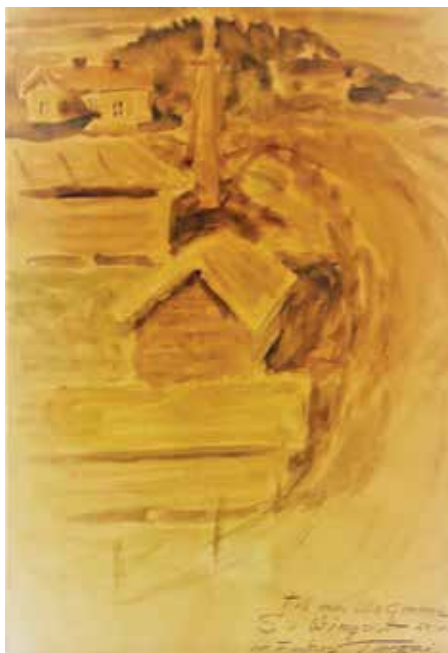
Tiikerin vesivärimalaalaus Till Min Lilla Granne Kaukon talon maisemasta.