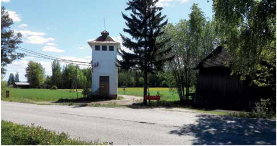
Kulttuurihistoriallisesti arvokas Rusutjärven muuntamo vuodelta 1934. Muuntamon takaa kulkee An-nankorvenkuja, jonka suunnassa oli satoja vuosia kinttupolku Hyrylään. Oikealla Eskolan tanssiladon kulma.