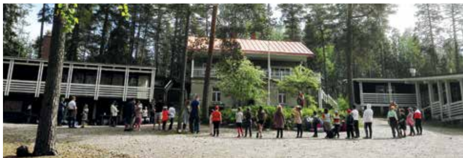
Kesällä näkyy Tiikerin talo, jonka molemmat puolet on Keravan kaupungin suunnittelema laajennus. Tiikerin aikana talon etusivulta nousi toisen kerroksen kaksikaarevia kiviportaita pitkin. Kesäretkin nuoret leirinsä aloituksessa 8.6.2020.

Tiikeri asui nykyisellä Keravan kaupungin omistamalla Kesärinteellä pitkiä aikoja 1931