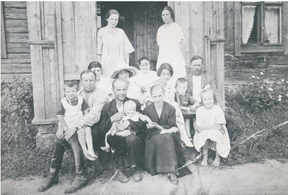
Kuva 2 (S-t); Kotitila Uudentalon rappusilla Karjalohjan Kuusian kylässä vuonna 1924.

Kun valta oli vaihtunut, palasin jatkamaan opintojani. Heinäkuussa osallistuin kolmen viikon sotilaslääkärikurssille, jolla saksalaiset asiantuntijat luennoivat ansiokkaasti.