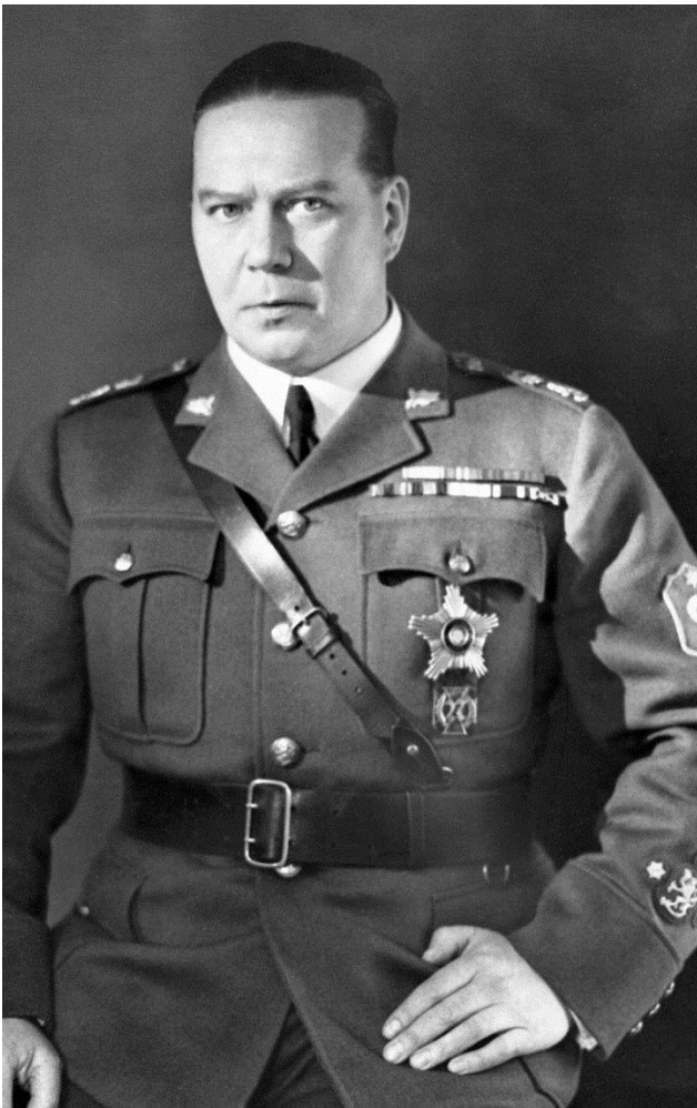
Lauri Malmberg Suojeluskuntien ylipäällikkönä

Suojeluskuntien lakkautuksessa myös kenraaliluutnantti Malmberg erosi. Siviilielämässä hän toimi vakuutusosalalla ja aikoi kirjoittaa muistelmansa, mutta kuoli jo vuonna 1948 vakavaan sairauteen. Hänet on haudattu Helsinkiin Hietaniemen hautausmaahan.