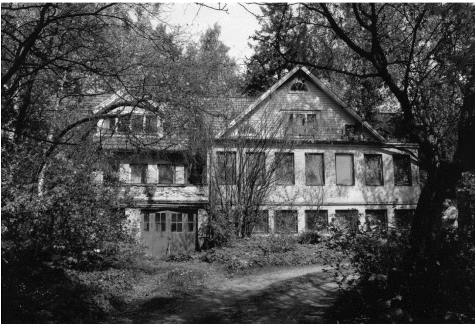
Kuva 11 Keravan museo; Hakalantie 20, koti ja vastaanotto. Kuva on otettu juuri ennen purkamista vuonna 1990.

Siunauspuheessaan rovasti Helasvuo lausui mm. seuraavaa: ”Väinö Lindén oli monipuolisesti lahjakas, omaperäinen persoonallisuus, joka aktiivisesti osallistui kansamme itsenäisyystaisteluun ja kulttuurielämään.”