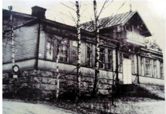
Venäläinen koulu ja myöhempi aliupseerikerho