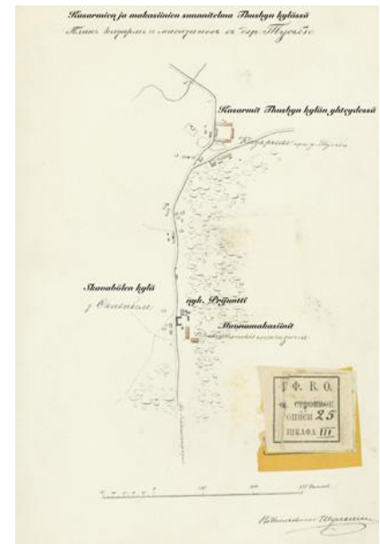
Hospitaalilin ja makasiinien suunnitelmapiirros