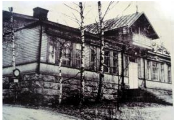
Venäläinen koulu ja myöhempi aliupseerikerho