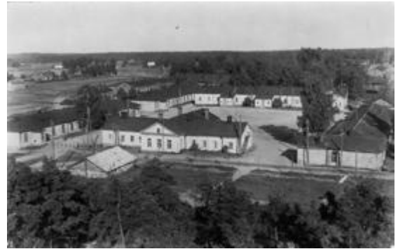
Hyrylän kasarmialue 1950-luvun alussa kuvattuna hyppymäen tornista, keskellä on paraatikenttä nykyisen pääterveysaseman paikalla.

Koulutuskeskuksessa tuli eteen uusia asioita ja aseita, joitten rakenteeseen ja toimintaan en ollut tutustunut. Omasta mielestäni opin kaiken nopeasti, ja senkin takia koulutus alkoi pian tuntua pitkästyttävältä. Kun varuskunta oli asutuskeskuksessa ja ympärivät maat pääasiassa yksityisessä omistuksessa, se asetti rajoituksia harjoittelulle. Niinpä oli hyvin vähän sellaisia paikkoja, joissa voitiin tehdä kaivautumisharjoituksia. Suunnistaa voi yksityistenkin mailla, ja siihen minä kovasti miellyin.”