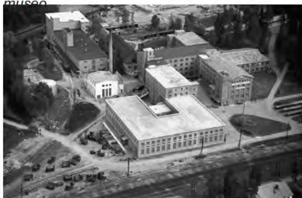
41. Suuri kumitehtaan kiinteistö v 1957.