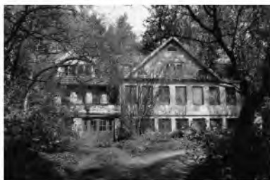
11. Hakalantie 20, koti jāvastaanotto. Kuva on otettu juuri ennen purkamista vuonna 1990. Puutarhassa puun takana on MuseoMatti.