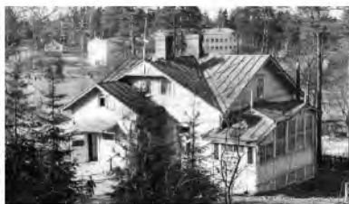
20. Tomtebo -huvila Aurinkomäen luoteisrinteessä. Rakennus on kuvattu Aurinkomäen rinteeltä 1950-60-lukujen taitteessa. Huvilan takana näkyy Keravan keskuskansakoulu.