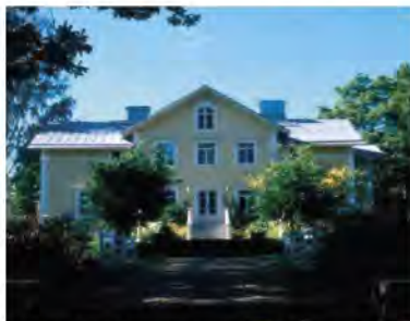
Lapilan kartano on kaupungin edustustila, jota voi vuokrata juhliin. Kuva pihan puolelta kuvattuna 1998, Matti Karttunen/Keravan museo.

tehtaan toiminta päättyi sota-vuosina ja Keravan kauppala osti lopulta maat vuonna 1962. Maista oli jo myyty melkoinen osa tonteiksi.