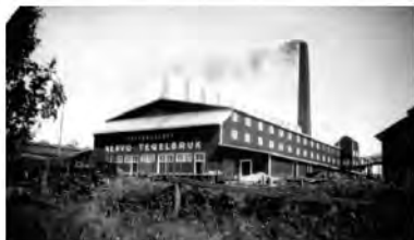
32. Keravan Tiilitehdas 1938.

Kun kuljetaan Sibeliuksen-tietä radan ali Ali-Keravalle, jää oikealle Lapila-konsernin lippulaivan - Keravan Tiiliteollisuuden alue nykyisessä Jaakkolassa.