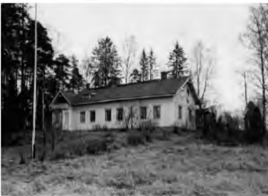
42. Jäspilän puolikas siirtyi 1911 Savion Tiilitehtaan