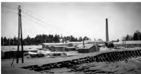
Keravan Puuteollisuus Oy:n tehdasalue vuonna 1950 Asemansillalta nähtynä. Kuva 1950 Veijo Laine/Keravan museo.

Nykyisin tehtaan paikalta kuljetaan Heikkilänmäen Hätäkeskuslaitoksen luolaan.