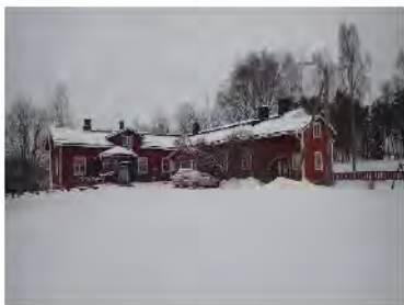
34. 1890 valmistunut Ali-Keravan koulu 2018.

Maantie Helsinkiin kulki Lapilanmäestä Hakalantietä Inkiläntielle, nykyisen Ali-Keravan koulun ohi etelään. Keravan vanhimman ja yhä käytössä olevan koulun löytää nyt osoitteessa Jokelantie 6.