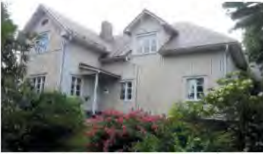
37. Etu-Mikkolan päärakennus 2018.