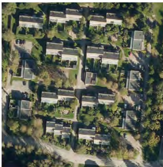
49. Aurinkokylän ilmakuva 2016.

Rakennettiin 1980-luvulla Aurinkokylä, jossa tutkittiin aurinkoenergian hyödyntämistä lämmityksessä. Projekti antoi runsaasti käyttökelpoista tietoa, vaikka aurinkoenergian hyödynnettävyys jäi kannattamattomaksi. Myöhemmin alue liitettiin kaukolämpöverkkoon asukkaiden aloitteesta.