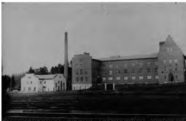
40. Tammenokan aikana rakennettiin Keravassa olevan Savion Tiilitehtaan tiilistä muurattu runkorakennus. Vaalea rapattu voimalaitos on sementtitehtaan ajalta. Kuva 20-luvulta Keravan museon

korvata tuontinahkoja. Tuotteina erilaiset työkengät sekä hevosten valjaat jne. Tehdas sai tilauksia myös Venäjän armeijalta maailmansodan aikana. Tehdas toimi vuosina 1914-1923, mutta raaka-ainepula vaikeutti tuotantoa.