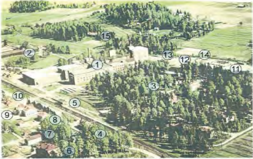
1) KUMITEHDAS 2) TIILITEHDAS 3) TEHTAANMÄKI 4) ASEMA 5) TAVARA-ASEMA 6) IMPILINNA 7) ALA-IMPILINNA 8) POSTI 9) PALOKUNNANTALO 10) ELANTO 11) UIMA-ALLAS 12) KUMIN JÄTTEENPOLTTOPAIKKA 13) NISSINOJA 14) RILLIRATA 15) SEURAKUNNANTALO