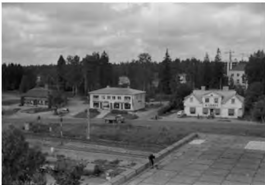
48. Näkymä Savion keskustaan kumitehtaan katolta 1970.

ruokala ja yläkerrassa virkailijakerhon tilat. Alakerran salissa järjestettiin tansseja ja juhlia. Ennen muuta Tesa oli saviolaisten elokuvateatteri, jossa paikkoja lähes kaksisataa. Tesan toiminta hiipui 1960-luvulla, kun televisio vei katsojat. Elokuvateatteri purettiin 30.3.1994.