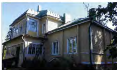
36. Yli-Jaakkola 2018.

Edessä Nissilän talon punainen pääty, keskellä viherävä Jurvala ja takana mäellä pilkistää Ollila, jonne talo siirtyi 1800-luvun lopulla. Mäen päällä ulkoilureitin varrella on Ollilan lampi - Ahjon helmi.