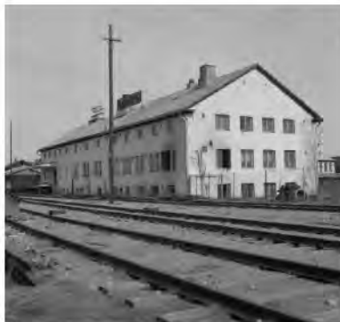
33. Ornon valaisintehtas toimi sodan jälkeen radan varressa tiilitehtaan alueella.

Valaisintehtas muutti Helsingistä Keravalle vuonna 1936 ja muodostettiin Oy Orno Ab. Stockmann ja Keravan Puuseppätehdas olivat pääomistajia ja tuotanto alkoi Puuseppäntehtaan tiloissa Valtatiellä. Molemmat tehtaot tuottivat suomalaisen muotoilun helmiä. Myöhemmin Orno oli osa ruotsalaista Asea-yhtymää ja lopuksi osa englantilaista Thom Emi yhtymää – muodostettiin Thom Orno Oy. Toiminta loppui vuonna 2001.