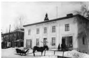
19. Helsingin Osakepankin konttori oikealla ja Pohjoismaiden Yhdyspankin vasemmalla (ns. Lindströmin talo) Asemantien varressa Helleborgin mäen itärinteessä vuonna 1939. Rakennusten välissä vuonna 1934 käytöön tullut puhelinkioski. Nikkarinkruunu ja Musiikkiopisto ovat rakennuksissa paraatipaikalla.